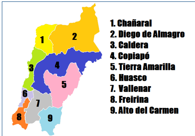
Figura N° 1. Región de Atacama

La Región de Atacama tiene una superficie de 1.382.033 km 2 , está integrada por tres provincias: Chañaral, Copiapó y Huasco, que en su conjunto están compuestas por nueve comunas, las cuales conforman el límite sur del desierto de Atacama, paisaje dominante en la región.